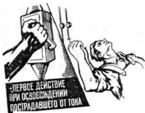
Рис. 1. Освобождение пострадавшего от действия электротока путем отключения электроустановки

6.1. Быстрое отключение от действия электрического тока это первое действие для спасения пострадавшего.