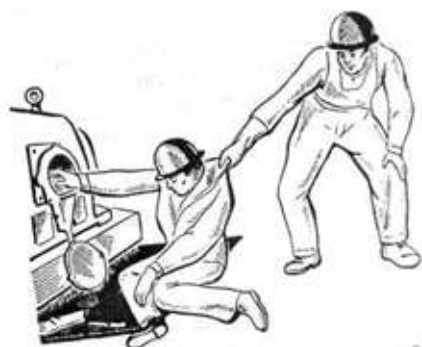
Рис. 3. Освобождение пострадавшего от действия части, находящейся под напряжением до 1000 В