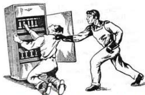
Рис. 4. Освобождение пострадавшего от токоведущей электрического тока

6.2. При поражении электрическим током необходимо быстро освободить пострадавшего от действия тока - немедленно отключить ту часть электроустановки, которой касается пострадавший. Когда невозможно отключить электроустановку, следует принять иные меры по освобождению пострадавшего, соблюдая надлежащую предосторожность